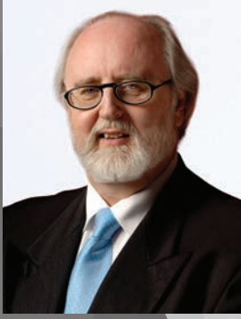
دومنيك ماكبولين رئيس مكتب التخطيط المركزي